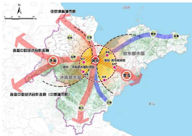
图 1 潍坊区域协作发展格局